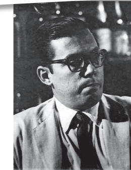
A la izquierda, el escritor Guillermo Cabrera Infante y su mujer, Miriam Gómez. Sobre estas líneas, página manuscrita de su gran novela, «Tres tristes tigres», y una imagen de juventud del autor