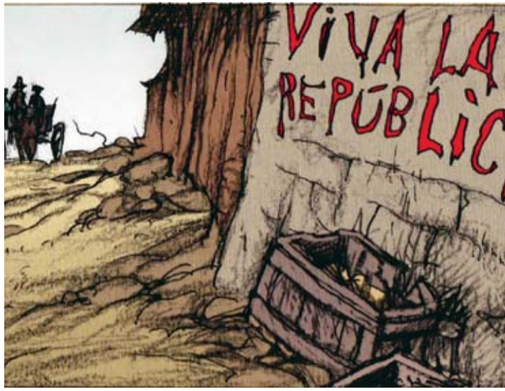
Pendant la guerre d'Espagne, les Brigades internationales ont entre-tenu brièvement le mythe d'une Europe libertaire.

Roman graphique España la vida ** VACCARO, LE ROY, JOUVRAY Casterman 120 p., 25 euros