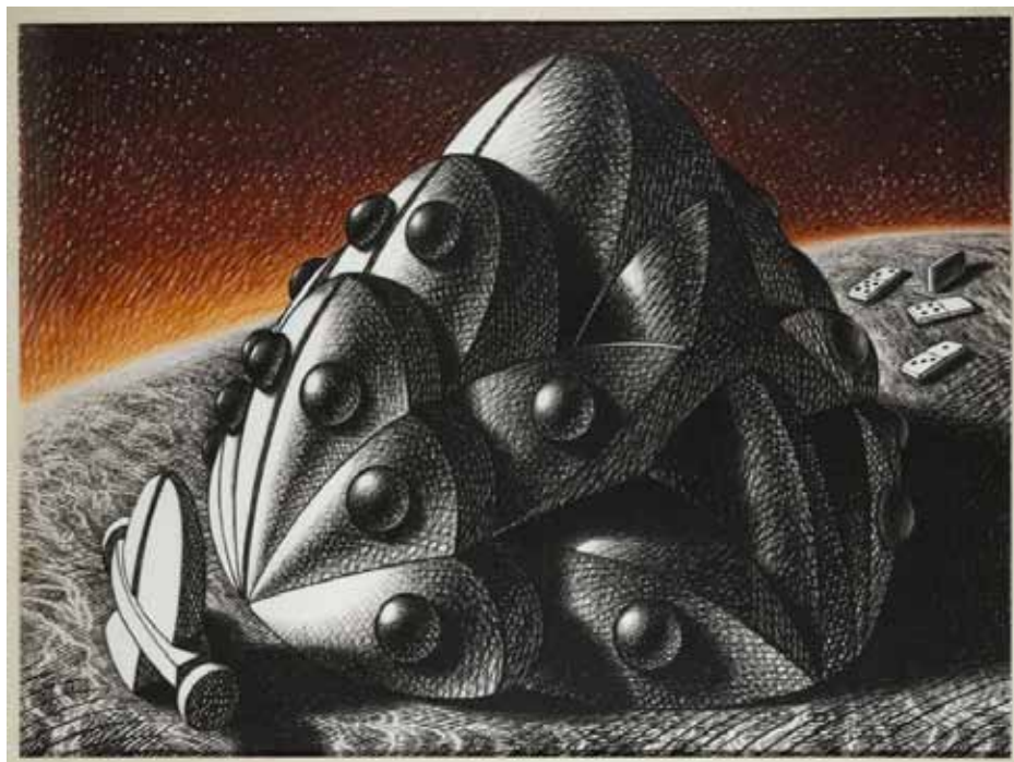
Jose Ramon ALEJANDRO (né en 1943)

Composition, circa 1965 Pastel sec sur papier signé 100 x 130 cm 6 000 / 8 000 €