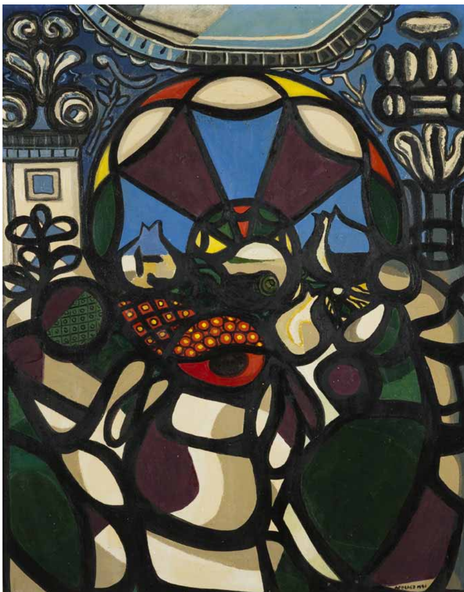
Amelia PELAEZ (1897-1968) Composition, 1941 Huile sur toile signée et datée en bas à droite 109,3 x 86,3 cm 150 000 / 200 000 €