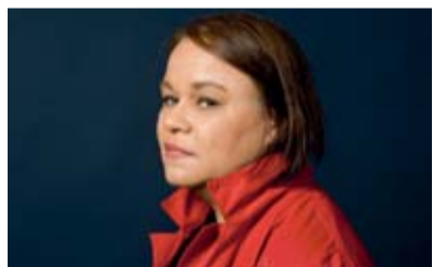
Zoé Valdés, écrivaine cubaine à Paris.