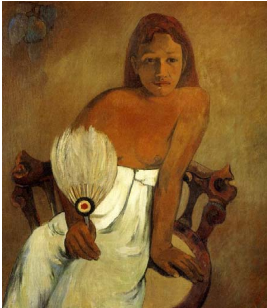
« Jeune fille à l'éventail », de Paul Gauguin, 1902. A droite, « Autoportrait au chapeau », de Paul Gauguin, 1893-1894.

Il boit du laudanum, se pique de morphine pour supporter la douleur. Mais c'est cet homme qui avait décidé « de se battre contre le monde pour le rêve d'une unique aspiration, appelée art, et pour la liberté ». La fille du Chinois lui apporte un peu de nourriture. Il aimerait la caresser, elle se dérobe. Alors il rêve, à